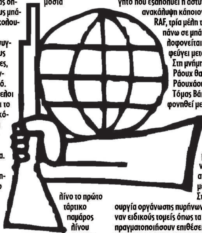
ήνιο το πρώτο τάρτικο παμάρος ήνιο το παρά-

ουργία οργάνωσης πυρήνων που θα αναλάμβαναν ειδικούς τομείς όπως τα εργοστάσια, για να πραγματοποιήσουν επιθέσεις ενάντια στα αφεντικά. Αναζητούν οπλισμό και ακολουθούν κνηνητά, συλλήψεις, καθώς και επιθέσεις σε τράπεζες στα πλαίσια πάντα της αρχής «δεν πυροβολούμε για λεφτά» κατά τις οποίες μοιράζουν σοκολατάκια στους πελάτες καθώς και το οικονομικό πρόγραμμα της οργάνωσης. Οι ενέργειες αυτές θίγουν την RAF που τους αποκαλεί ηαϊκιστές. Με τα χρήματα από τις τράπεζες χρηματοδοτούν πολλά πολιτικά εγχειρήματα, ομάδες αντίστασης, ομάδες σε εργασιακούς χώρους, εφημερίδες κ.α.